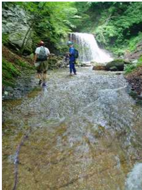
F4 から F5 へ続く気持ちの良いナメの廊下。